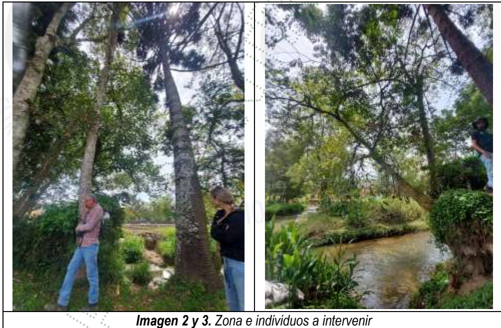
Imagen 2 y 3. Zona e individuos a intervenir